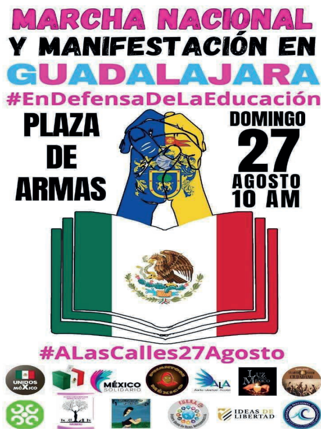
Imagen 1. La convocatoria al evento

A partir de esta primera aproximación a los sujetos abordados en el presente escrito, los términos que componen los nombres de sus organizaciones nos remiten a un imaginario colectivo que evoca una serie de valores que los vincula con una construcción de distintos campos políticos, algunos más de corte ciudadano (con mandantes constitucionales), otros relacionados con la analogía de la luz en su entendido como contraposición a la oscuridad. Asimismo, otros términos como el de libertad se resaltan como un valor supremo para la construcción de la democracia. Lo mismo sucede con el epíteto de anticomunistas. Es de notarse que en este término se condensa un espíritu que evoca a los tiempos de la Guerra Fría, esta vez personificada por lo que en términos gramscianos podemos comprender como “la batalla cultural”. Aunque no son los únicos nombres visibles, sí son especialmente representativos en cuanto a los componentes ideológicos principales.