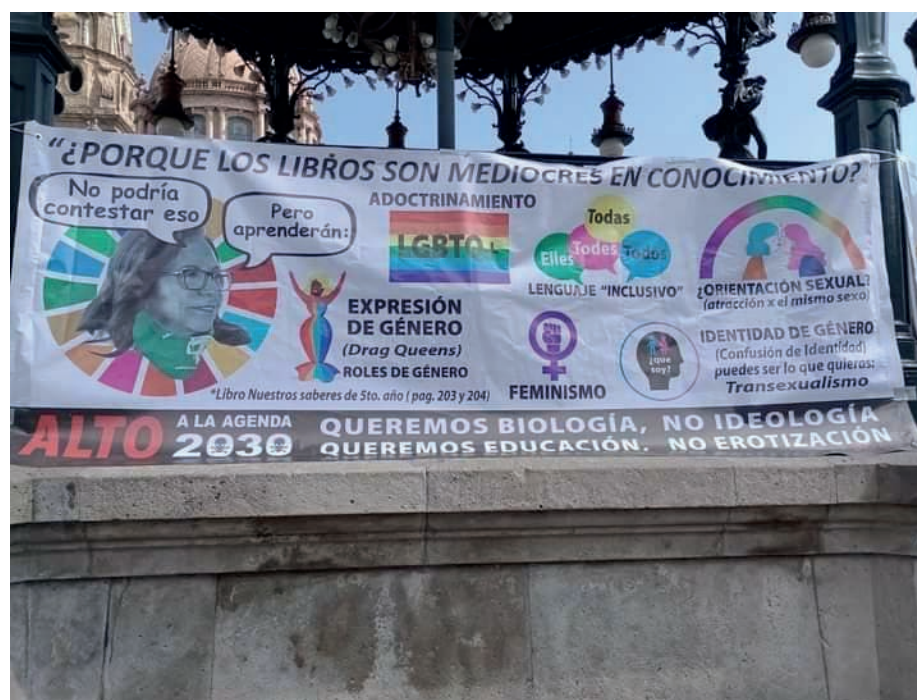
Fotografía 1. El quiosco y sus lonas

El quiosco de la Plaza de Armas fue adornado con una serie de lonas que hacen alusión a la médula ideológica de los colectivos convocantes. Haciendo énfasis justamente en discursos que se han repetido en las redes sociales y en los discursos oficiales de los integrantes de estos colectivos. La articulación política de estos colectivos recae en que los LTG están llenos de ideología de género y en palabras de una de las ponentes en el evento “obedecen a la agenda 2030” que ha sido dictada por la “malévola” Organización de las Naciones Unidas (ONU). Asimismo, había dos puestos de registro y de reparto de información, se encontraban en cada esquina de la plaza y en estos se recababan los nombres, teléfonos y emails de los asistentes.