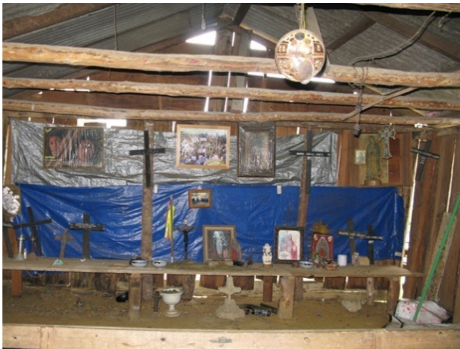
Foto 4. Aspecto del interior de la ermita el 22 de abril de 2011.

En este texto, el Frayba advierte cómo el Estado mexicano se ha empeñado no sólo en garantizar sino en profundizar la situación de impunidad y recuerda como en el 2009 la Suprema Corte de Justicia de la Nación resolvió amparos promovidos por la defensa de los paramilitares favoreciendo primero a 29 personas; en 2010 a 15; y, en 2012 a 7. Lo que suma 59 autores materiales de la masacre (considerando 6 personas absueltas por un juez penal en 1998, más otras 2 liberadas por razones de humanidad).