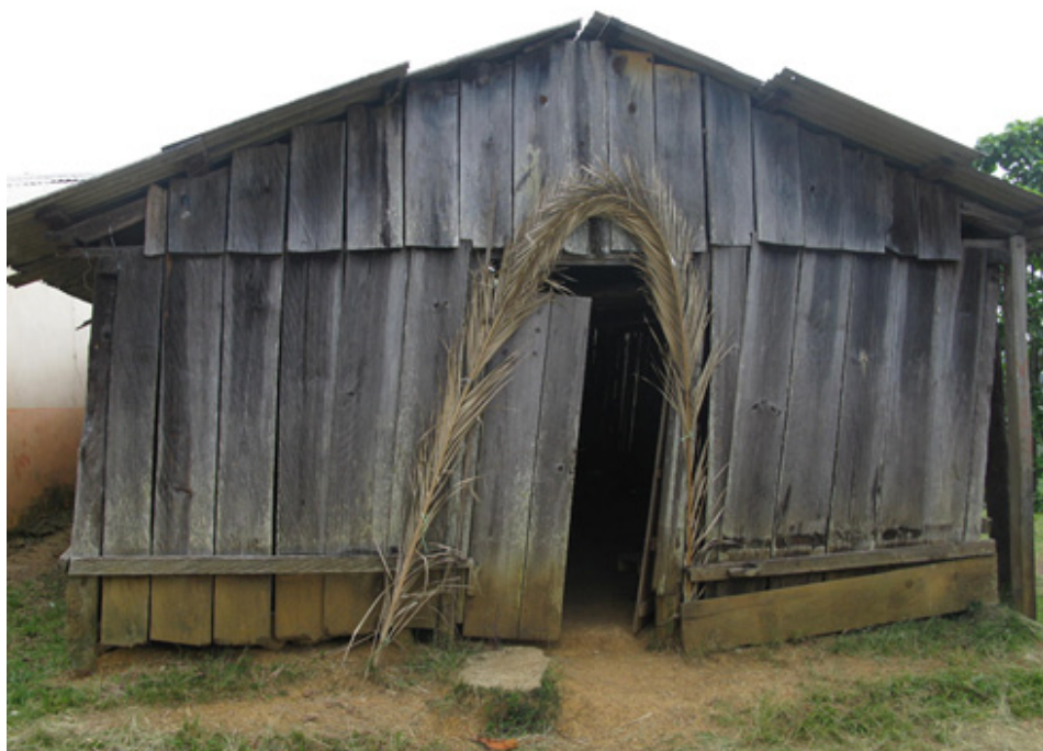
Foto 2. Ermita en la que se encontraban orando los desplazados en el momento en que arribaron los paramilitares

Lejos de la versión oficial, desde el primer momento quedó claro que detrás de la masacre se encontraba la mano del Estado y que las condiciones para que este crimen se llevara a cabo habían sido preparadas por el propio gobierno con mucha antelación. La matanza fue ejecutada por alrededor de noventa personas, quienes operaron respaldadas por un puesto de operaciones mixtas –integrada por militares, policías judiciales y de seguridad pública– que se encontraban a 200 metros de distancia de la comunidad. Las víctimas eran personas desplazadas y miembros de la comunidad de Acteal y al momento de ser atacadas realizaban una jornada de ayuno y oración por la paz y la justicia en la humilde ermita de la comunidad. Los agresores actuaron sin prisa, ingresaron a Acteal alrededor de las once de la mañana, hacia las seis de la tarde todavía se escucharon detonaciones de armas de fuego.