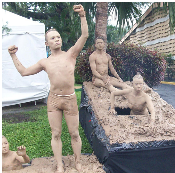
Foto Durante la toma de posesión del profesor Salvador Sánchez Cerén. Fuente: Paula Delgado, junio 1 de 2014.

Como todo gobierno progresista, el gobierno salvadoreño seguramente tendrá éxitos y fracasos, pero ante todo el compromiso ineludible de mantener la lucha en defensa de los derechos humanos, los derechos sociales, económicos y políticos y en especial la lucha contra el neoliberalismo.